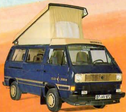
Club Joker 1