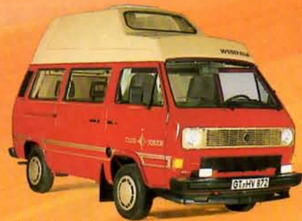
Club Joker 3

Auto für alle Tage. Fahrzeug für Geschäft und Hobby. Wohnmobil für Ferien und Freizeit.